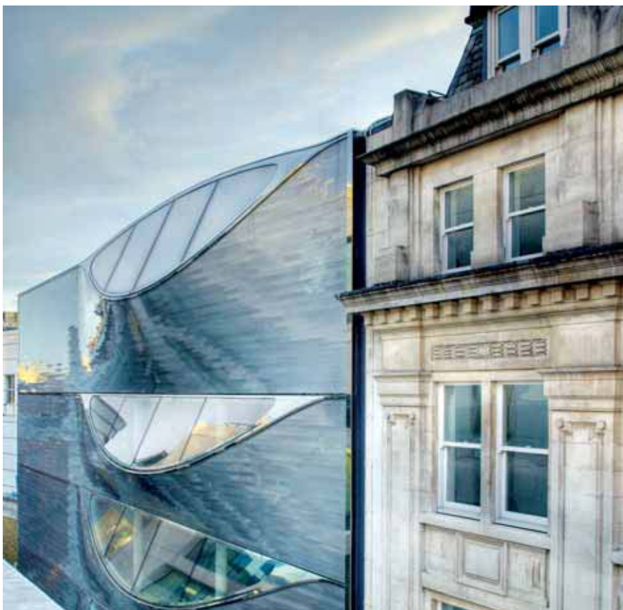
Il suggestivo rivestimento metallico realizzato da Frener & Reifer per il Hill's Place a Londra.

A caratterizzare l'intervento è la scocca metallica cangiante, costituita da doghe di alluminio estruso di 14 cm di larghezza e lunghe circa 3 m. L'effetto bombatura ha richiesto infatti un anno di studi e test da parte del costruttore che ha trasferito tecniche e modalità costruttive di altri settori come il navale. L'edificio ha una forma che ricorda proprio quella di una nave, senza giunti, una superficie metallica