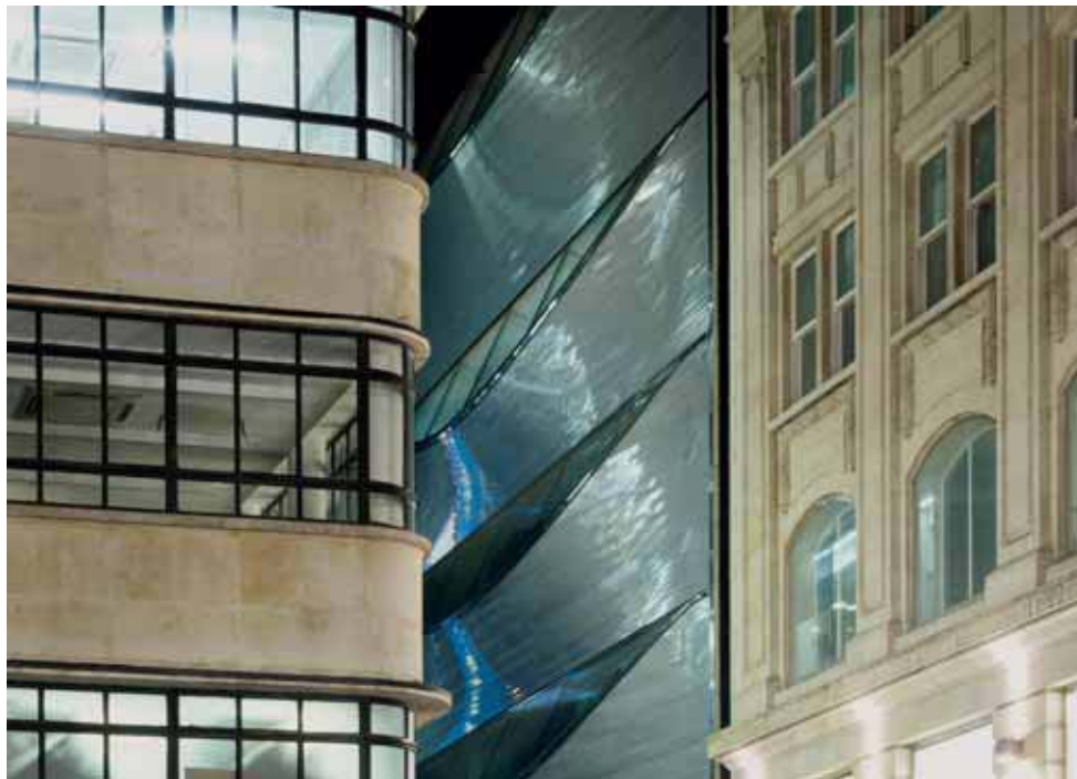
Grazie alla verniciatura liquida lucida, il rivestimento muta di tonalità nel corso della giornata in funzione della diversa luce.

In Italia il concorso è stato organizzato da Alubuild (gruppo di lavoro formato dalle Associazioni italiane, Aital, Centroal/Assomet, Qualital, Uncsaal) e sponsorizzato da Affg (Aluminium For Future Generations - Alluminio per le generazioni future).